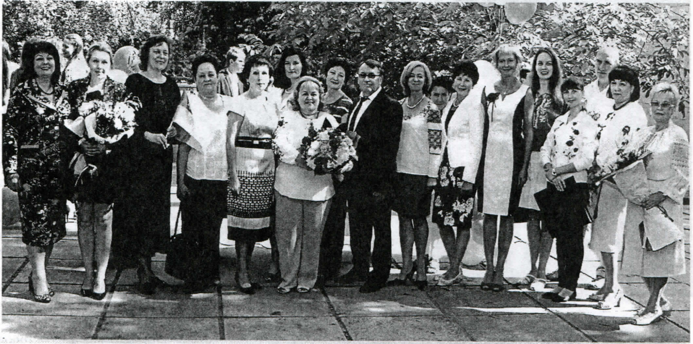
І зараз ми разом. 2014 рік

Все це хімія, якої в ліцеї навчили правильно.